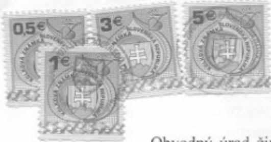
foto rozhodnutie nadobudlo právoplatnosť dňa: 12.03.2012 v Dunajskej Strede dňa: 12.03.2012 Podpis: _____